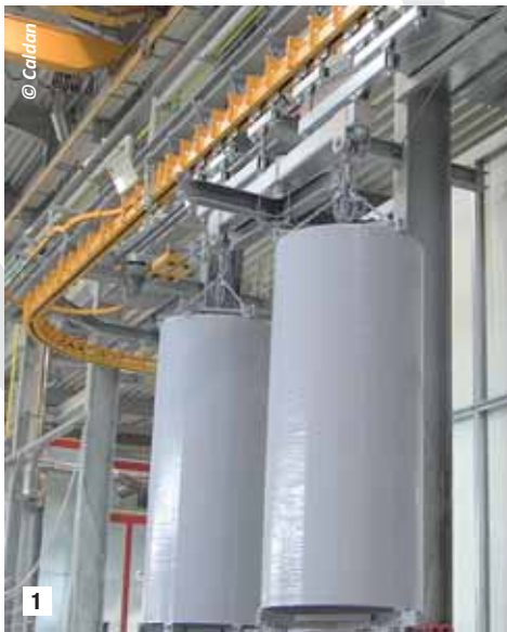
1 Overhead conveyor - operating in Austria. Trasportatore a soffitto in funzione in Austria.

Per maggiori informazioni: www.caldan.dk ■