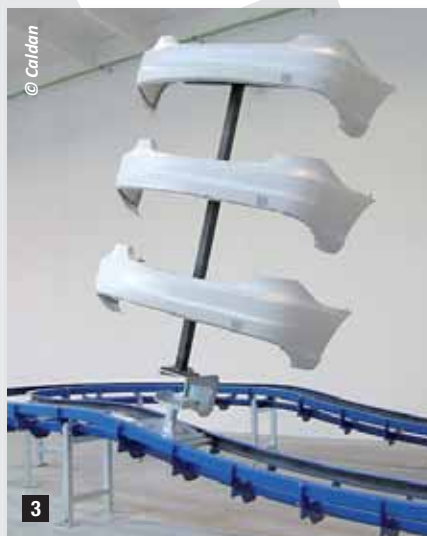
3 Floor conveyor - operating in Russia. Trasportatore a pavimento in funzione in Russia.