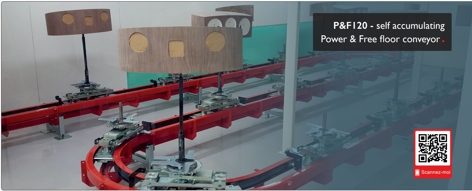
P&F120 - self accumulating Power & Free floor conveyor .